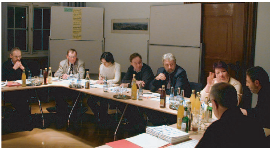
Die Expertenrunde "Umwelt" diskutiert die Projektideen aus ihrem Handlungsfeld

Was der Tisch "Jugend" an Ergebnissen produzierte, wurde mit allen interessierten Jugendlichen bei einem öffentlichen Workshop am 30.10.03 diskutiert und ergänzt. Beim Thema Ausbildung kam als Projekt der Vorschlag hinzu, einen Austausch zwischen den in den Memminger Betrieben tätigen Lehrlingen zu organisieren. Wichtig waren den Jugendlichen auch klare Ansprechpartner. Initiativen aus der Jugend heraus wie Veranstaltungen oder das Internetportal www.memmingen-live.de sollen so besser als bisher umgesetzt werden.