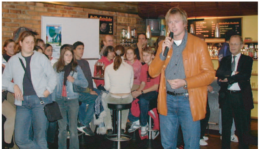
Jugend ganz prominent: Beim Jugendworkshop standen die Wünsche der jungen Menschen an erster Stelle

Ein gutes Beispiel für den lebendigen Prozess perspektive memmingen ist das Handlungsfeld Jugend. Die Auftaktveranstaltung zeigte, dass ein Defizit bei Angeboten für Jugendliche besteht. Als Reaktion darauf wurde für die Jugend einer der acht Thementische der Zukunftskonferenzen reserviert.